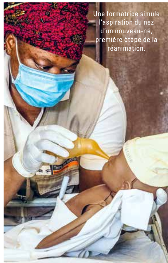
Une formatrice simule l'aspiration du nez d'un nouveau-né, première étape de la réanimation.

formatrice, donne un cours sur la réanimation. Elle rit, mais son ton redevient