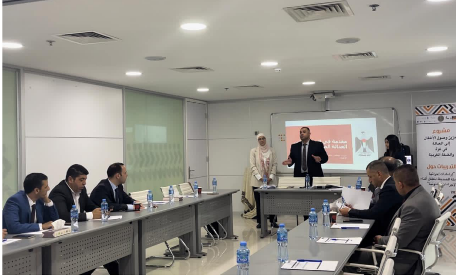
صورة من ورش العمل التشاركية مع أعضاء النيابة العامة