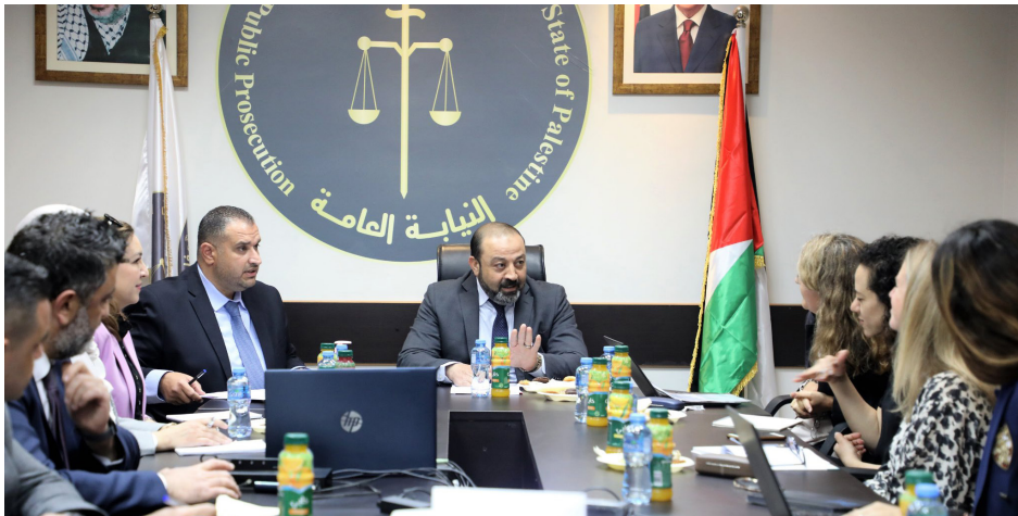
"اجتماع النائب العام / المستشار أكرم الخطيب مع ممثلة اليونيسيف في فلسطين وبحضور رؤساء النيابة المتخصصة" وذلك بشأن "الإرشادات التوجيهية للمعاملة الصديقة للطفل أثناء الإجراءات القانونية"