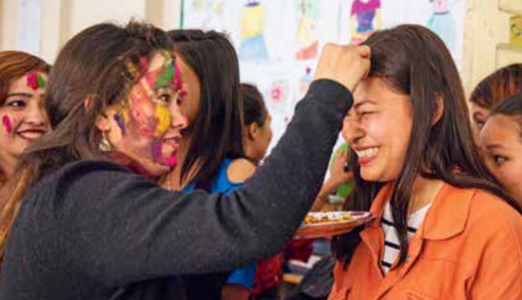
^ Celebrazione della festa dei colori al centro di accoglienza diurno per le giovani di Katmandu.