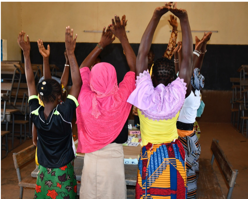
Des filles participent à une activité destinée à « briser la glace », à Ouahigouya pendant la première étude.

Malgré la richesse de leurs contributions, les enfants ont répété qu'elles et ils ne pensaient pas avoir le droit de donner leur opinion sur l'aide qui leur est destinée. De nombreuses démarches pour améliorer cette situation sont déjà menées par des organisations spécialisées dans la protection des enfants depuis des années. En 2024, la Fondation Terre des hommes (TdH) et Ground Truth Solutions (GTS) ont lancé le projet Humanitaire et assistance redevable pour les enfants (HARPE), soutenu par le fonds innovation de la Fondation TdH, pour compléter et soutenir ces initiatives. L'objectif ? Encourager une plus grande participation des enfants dans les projets humanitaires en développant des outils accessibles aux organisations, permettant de prendre en compte leurs voix et de valoriser leurs idées.