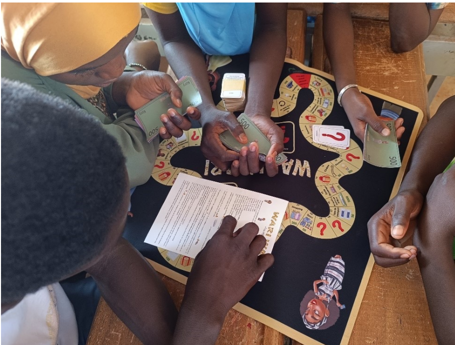
Séance de « game jam » avec le groupe d’enfants de Ouagadougou.