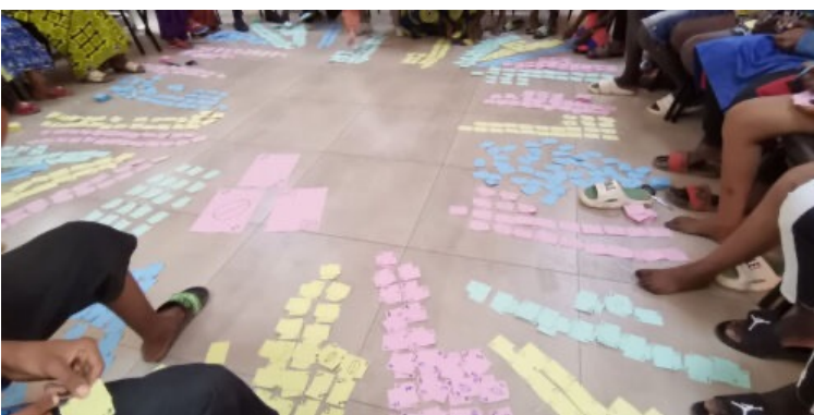
Session de co-création de l'outil consultatif avec le groupe d'enfants de Ouagadougou.

Une pression importante a également pesé sur les relations de travail entre les partenaires du projet, l'enjeu majeur ayant été de maintenir l'engagement de chaque organisation tout au long du déroulement, malgré les imprévus et les tensions résultant du manque de visibilité sur les résultats finaux. L'un des défis inhérents aux approches participatives est la nécessité d'accepter de lâcher prise, d'abandonner le contrôle total sur le processus et les résultats attendus, pour permettre une participation authentique. Lorsqu'il s'agit des enfants, le processus est d'autant plus complexe car il faut également déconstruire les relations de pouvoir entre enfants et adultes. Notre démarche a impliqué de céder une partie du pouvoir, d'accepter que le projet prenne des trajectoires inattendues, tout en préservant un cadre rassurant. Dans un secteur humanitaire habitué aux cadres logiques rigides et aux indicateurs quantitatifs, l'idéation 9 et l'itération sont encore peu connues ou reconnues. Ces approches, rendues possibles par la flexibilité du fonds innovation Terre des hommes, ont été déterminantes pour créer une méthodologie adaptée aux envies, besoins et capacités des enfants.