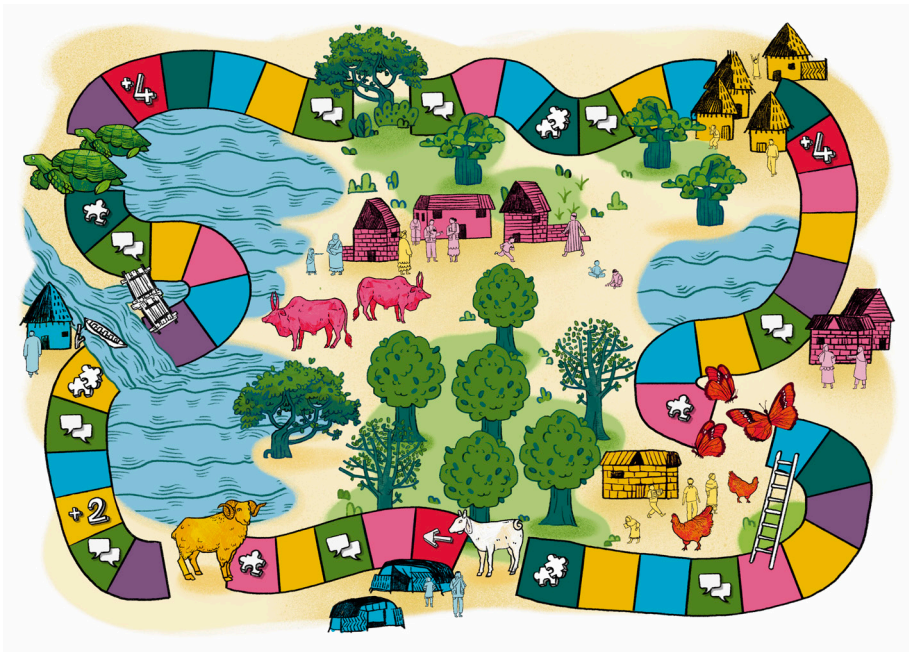
Plateau de jeu créé par Blandine Leroy, illustratrice professionnelle, sur la base des créations et des retours des enfants sur les esquisses.