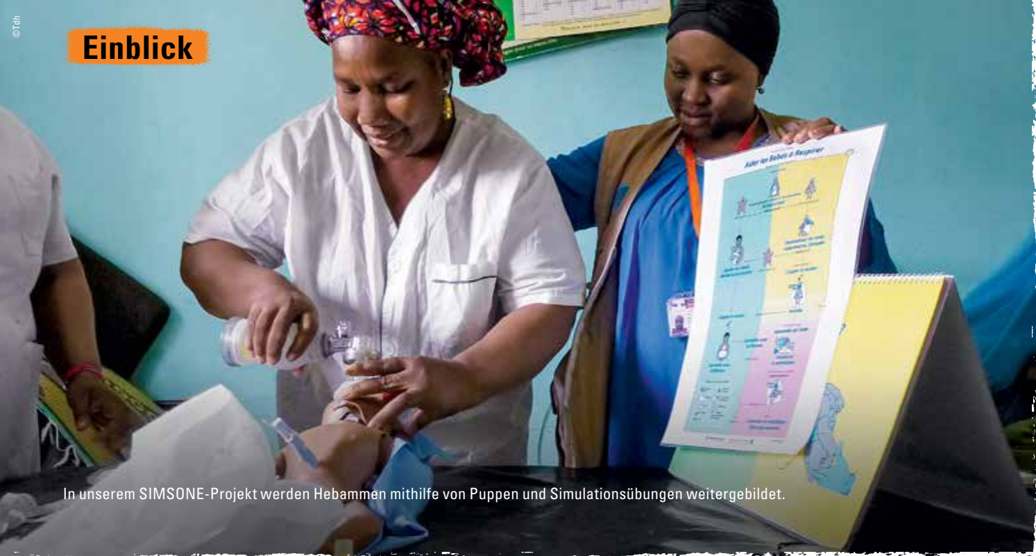
In unserem SIMSONE-Projekt werden Hebammen mithilfe von Puppen und Simulationsübungen weitergebildet.