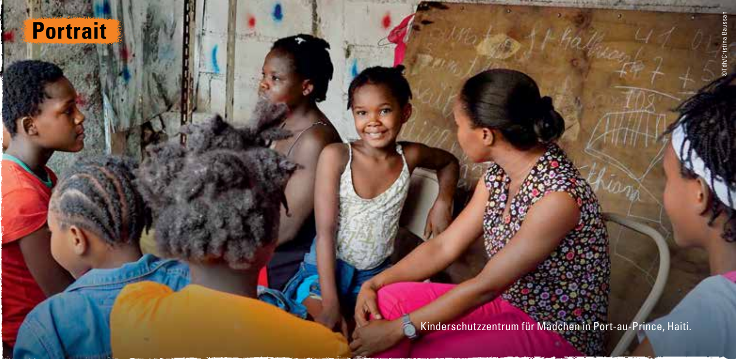
Kinderschutzzentrum für Mädchen in Port-au-Prince, Haiti.