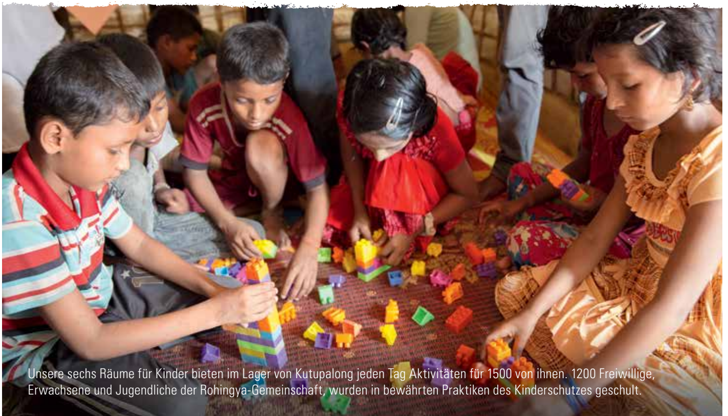
Unsere sechs Räume für Kinder bieten im Lager von Kutupalong jeden Tag Aktivitäten für 1500 von ihnen. 1200 Freiwillige, Erwachsene und Jugendliche der Rohingya-Gemeinschaft, wurden in bewährten Praktiken des Kinderschutzes geschult.

* Zum Schutz der Privatsphäre geänderter Name