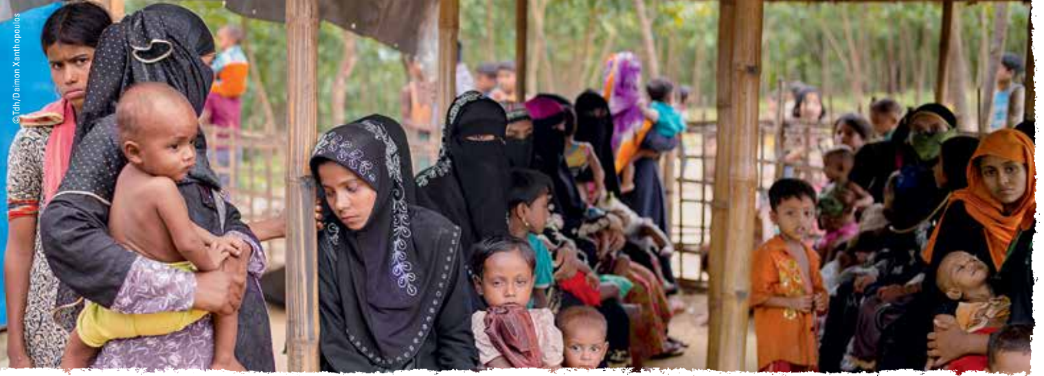
Warteschlange vor einem Tdh-Ernährungszentrum. Beinahe 15% der Rohingya-Kinder leiden unter schwerer Mangelernährung.